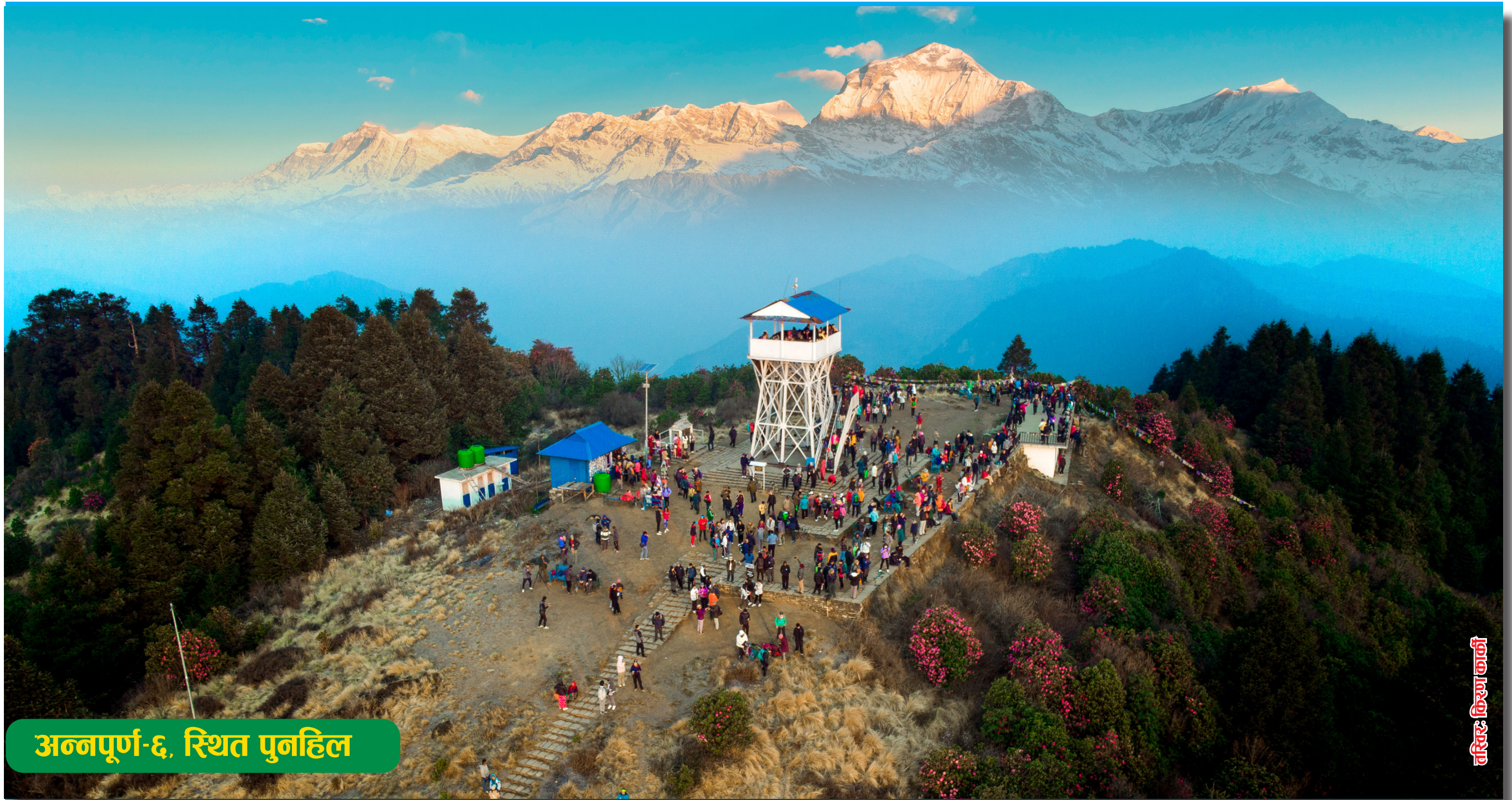
अन्नपूर्ण-६, स्थित पुनहिल