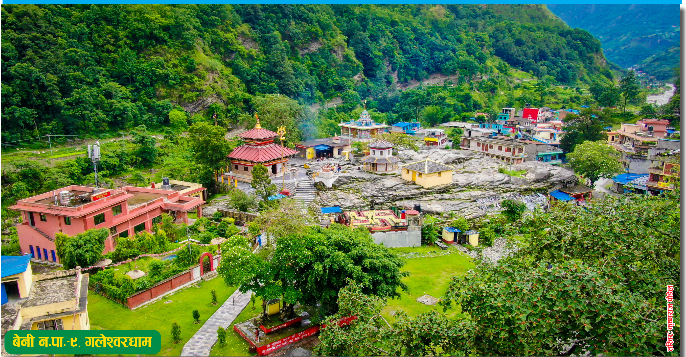
बेनी न.पा.-८, गलेश्वरधाम